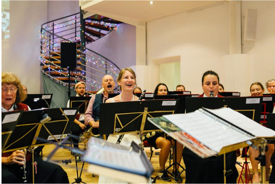
Die glückliche Braut ließ es sich natürlich nicht nehmen, auch ein wenig mit zu musizieren.